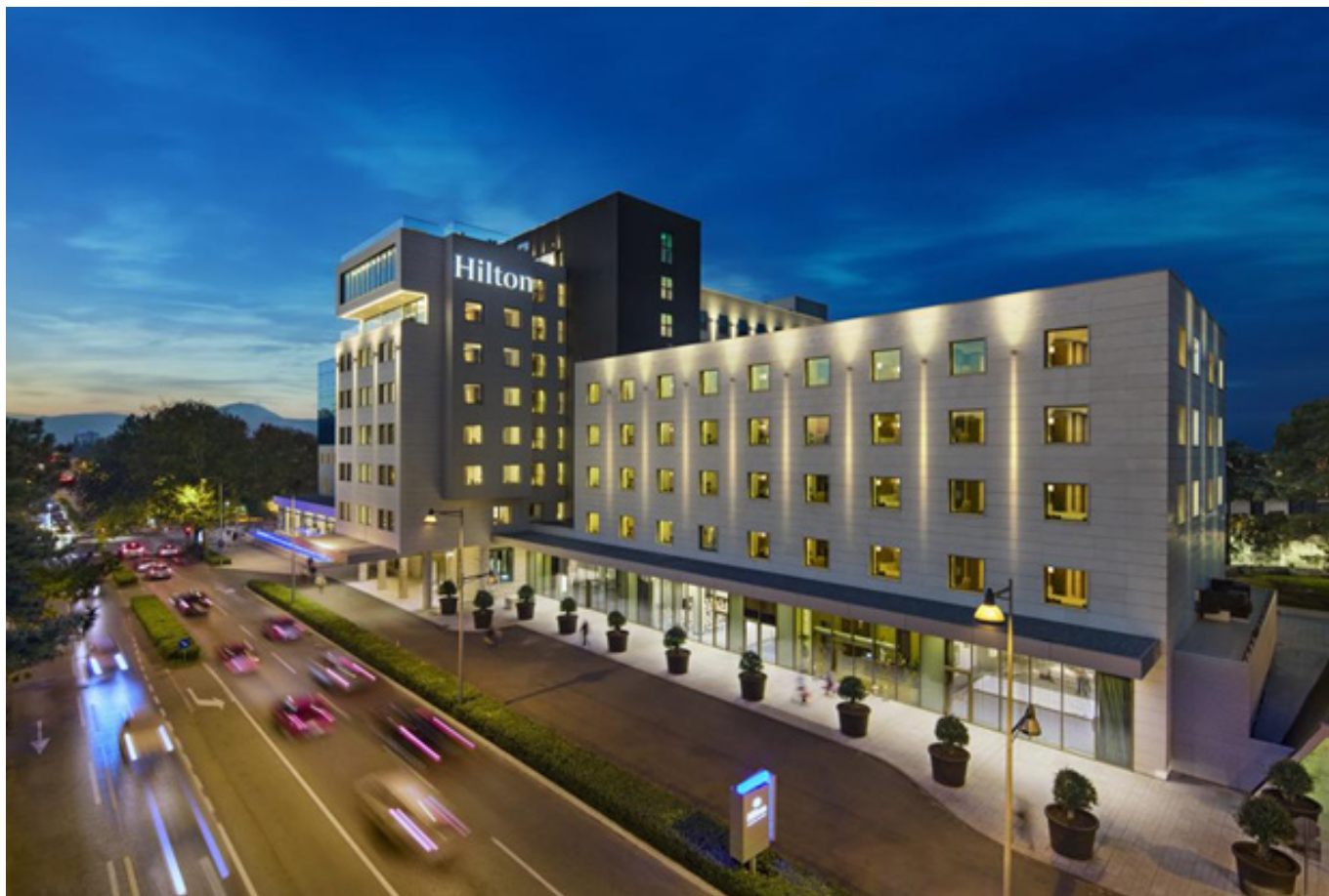
Hotel Hilton, Podgorica

Međunarodna konferencija Zeleni dani 2019: Ostvarivanje potencijala za zeleni rast održaće se u Hotelu Hilton, 5. i 6. juna 2019. Godine, u Podgorici, u Crnoj Gori.